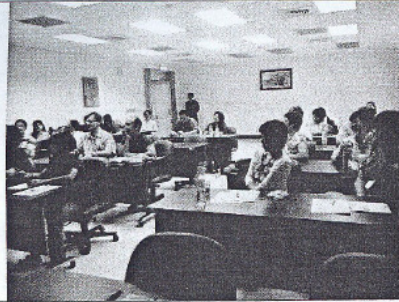
100/8/30 連鎖旅館之經營管理研習課程