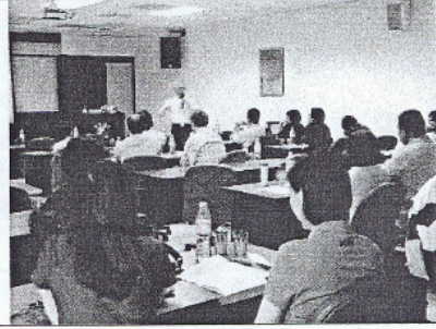
100/8/30 飯店組織架構與功能管理實務